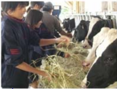
〔2年校外学習〕100%国産でまかなわれる牛乳の生産現場