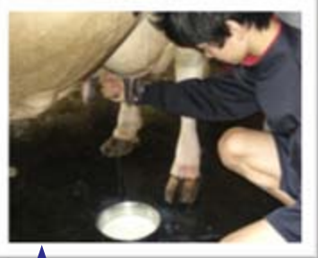
初めての搾乳(さくにゅう)体験

2年生は榎本牧場に行ってきました。はじめは牧場の臭いに圧倒されていた生徒のみなさんも、成牛のブラッシングではその毛並みの柔らかさに感動し、牛の鳴き声の高低に気付き、自分で作ったバターは大切に最後の最後までひとかけらも残さないようじゅっくり味わっていました。 また、牧草のラッピングの色がなぜ白と黒なのか等、しっかり牧場の方に質問する姿も見られました。五感の全てを使って酪農体験をすることができました。